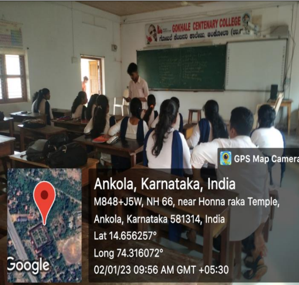
Ankola, Karnataka, India M848+J5W, NH 66, near Honna raka Temple